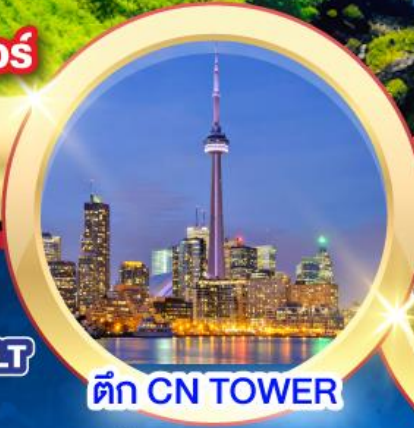
ตึก CN TOWER

★ ขึ้นตึก CN TOWER และ SUMMITONE VANDERBILT ★ อาหารค่ำหอคอยสกายลอน