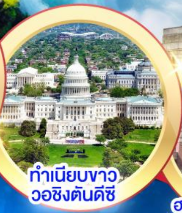
ทำเนียบขาว วอชิงตันดีซี