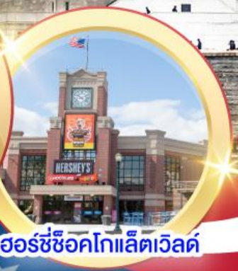
ฮอร์ชี่ช็อคโกแลตเวิลด์