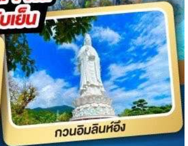
กวนอิมลินห์ฮิ่ง