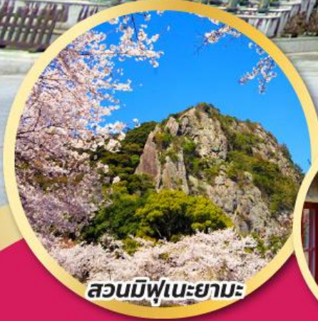
สวนมิฟูเนะยามะ