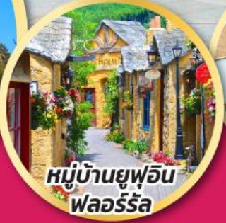
หมู่บ้านยูฟูอิน พลอร์ริล