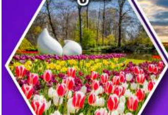
เทศกาลดอกไม้เคอเคนฮอฟ