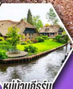
หมู่บ้านกังหัน