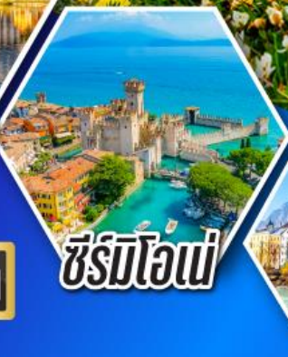
ซีร์มิโอเน่