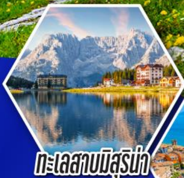
ทะเลสาบมิลสุรีน่า