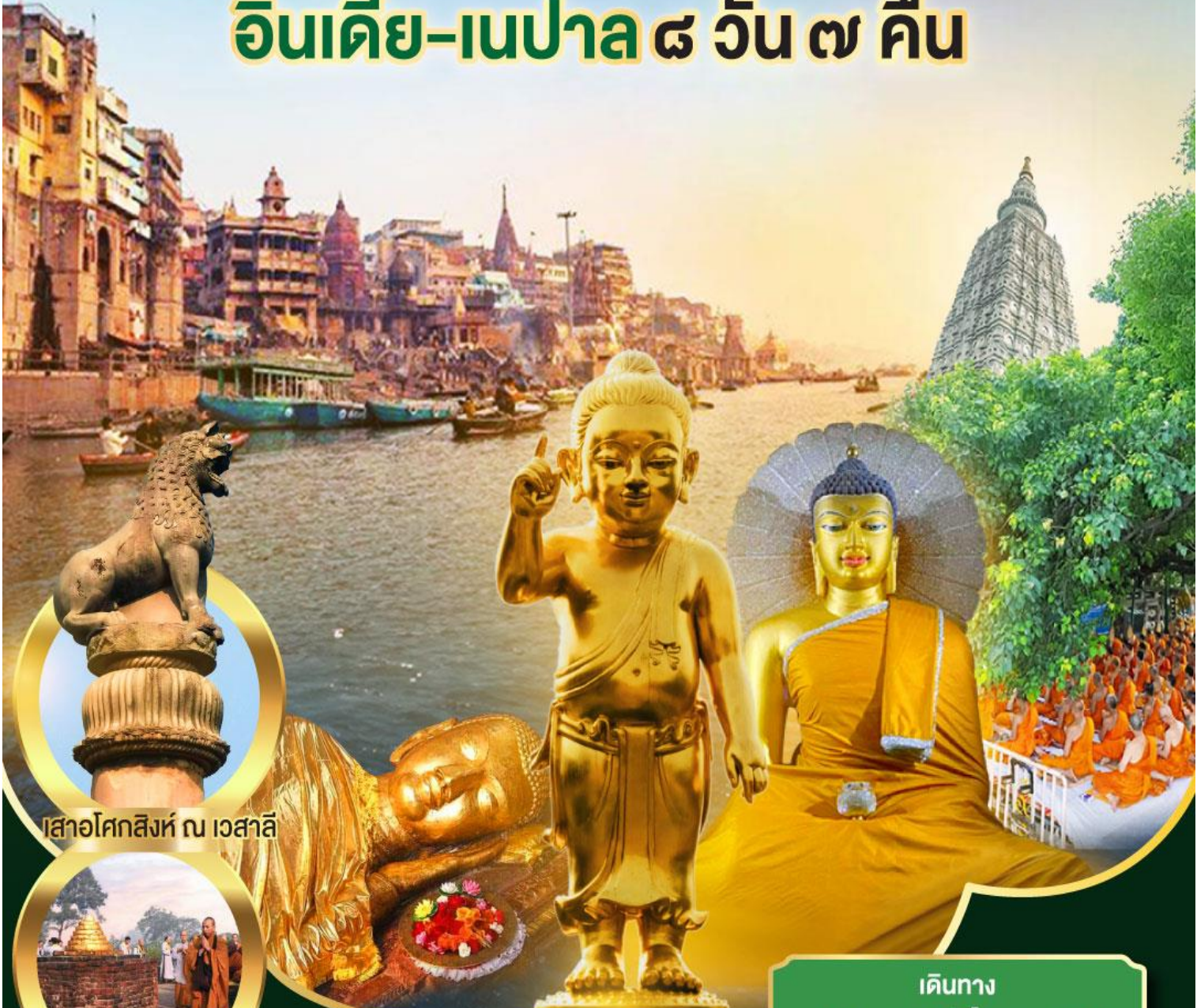
เสาอศกสิงห์ ณ เวสาลี