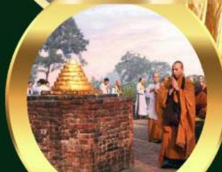
เขตวันมหาวิหาร เมืองสาวิตรี