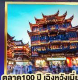
ตลาด 100 ปี เติ้งหวงเมี่ยว