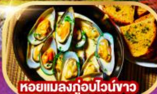
หอยแมลงภู่นิวไจซ์