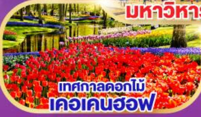
เทศกาลดอกไม้ เคอเคนฮอฟ

20-27 มี.ค. 68 / 29 เม.ย. – 06 พ.ค 68 04-11 พ.ค. 68