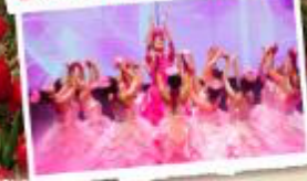
ชม CHARMING DANANG