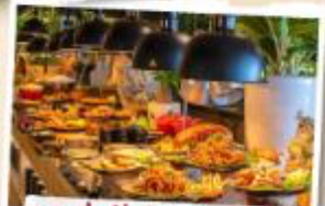
บุฟเฟ่ต์นานาชาติ