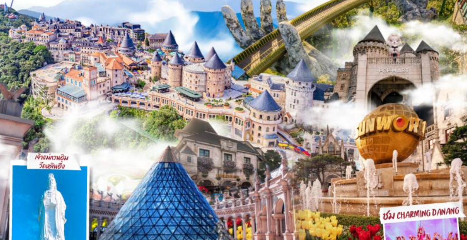
เจ้าแม่กวนอิม วัดเขากินซิ่ง