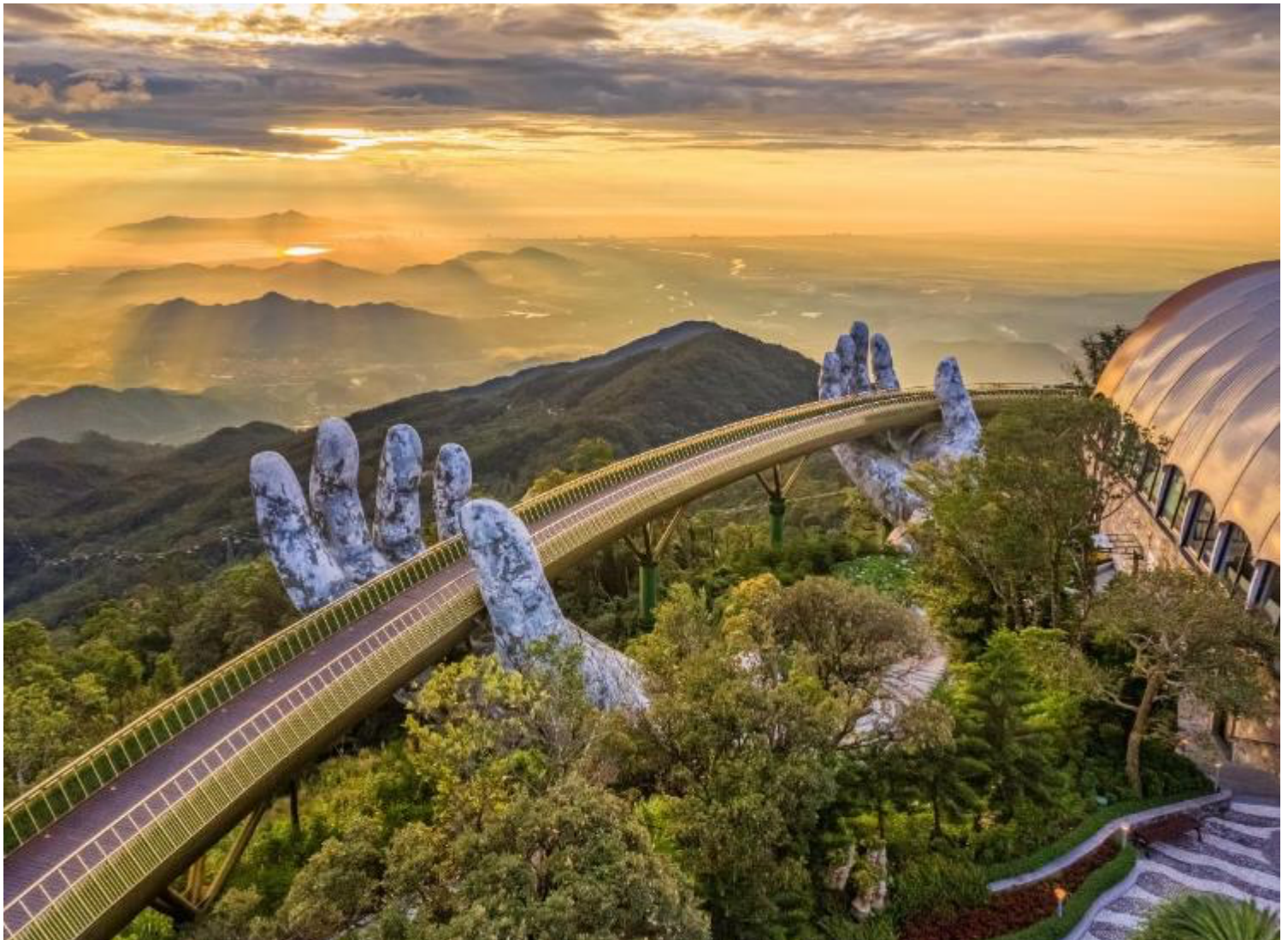
GO1DAD-EK001 เวียดนามกลาง ดานัง ฮอยอัน เส้นทางแห่งเมืองมรดกโลก นั่งกระเช้าขึ้นชมยอดเขาบานาฮิลล์ 3 วัน 2 คืน โดยสายการบิน Emirates Airline (EK)