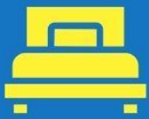
ห้องพักเดี่ยว SINGLE

ตัวอย่างประเภทห้องพัก *เป็นเพียงตัวอย่างเพื่อให้เห็นภาพสำหรับประเภทห้องในแบบต่างๆ