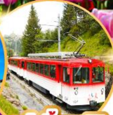
รถไฟซันเทารี

เดินทาง 01-10 เม.ย. 68 03-12, 04-13 พ.ค. 68