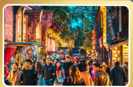
ถนนโบราณชอยกวางชอยแคบ