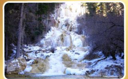
อุทยานหมอหนี่โกว