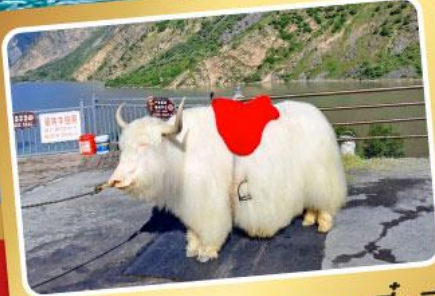
จามริกะเลสาบเตี้ยซี