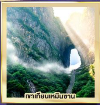
เวาเทียนเหมินซาน