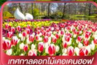
เทศกาลดอกไม้เคอเคนฮอฟ