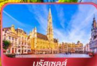
บรัสเซลส์