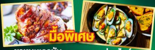
หมูพิเศษ พาหมูเยอรมัน หอยแมลงภู่อบไวน์ขาว