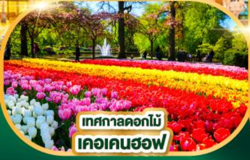
เทศกาลดอกไม้ เคอเคนฮอฟ