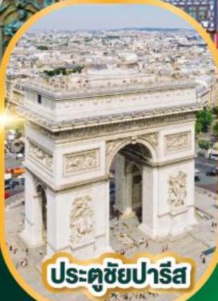
ประตูชัยปารีส