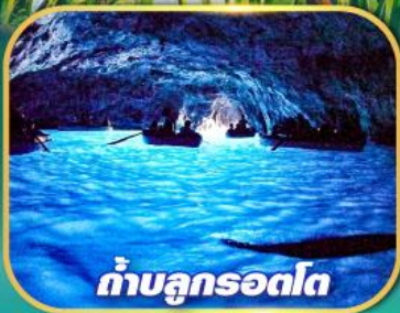
ถ้ำบลูกรอตโต