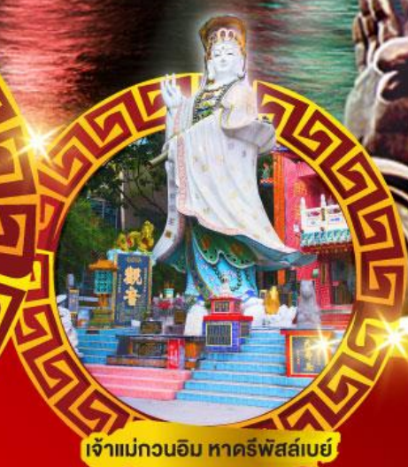
เจ้าแม่กวนอิม หาดริฟส์เบย์