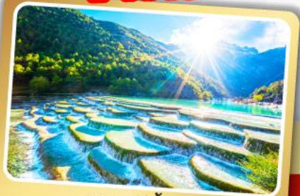
หุบเขาสีน้ำเงิน