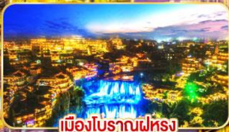
เมืองโบราณฟูหลง