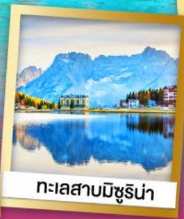
ทะเลสาบมิซูริน่า