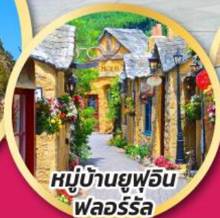
หมู่บ้านยูฟูอิน พลอร์ริล