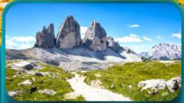
Tre Cime di Lavaredo