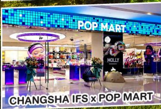
CHANGSHA IFS x POP MART