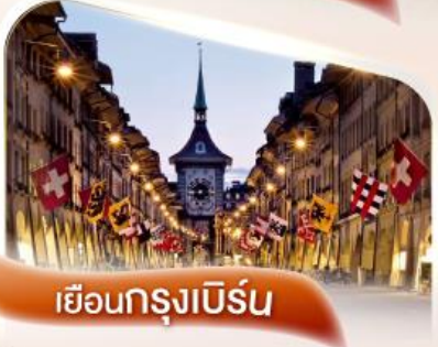
เยือนกรุงเบิร์น