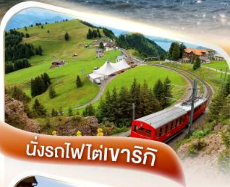
นั่งรถไฟไตเวาริกิ

เริ่มต้น 99,900.- ✓ การันตี นอนเมืองเซอร์แมท