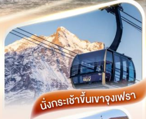
นั่งกระเช้าขึ้นเขาจุงเฟรา

เริ่มต้น 99,900.- ✓ การันตี นอนเมืองเซอร์แมท