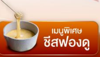
เมนูพิเศษ ชีสฟองดู