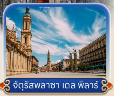
จัตุรัสพลาซา เดล ฟัลาร์