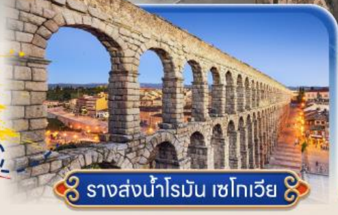
รางส่งน้ำโรมัน เซโกเวีย

สายการบินสัญชาติสเปน ✕ บินตรง Full Service