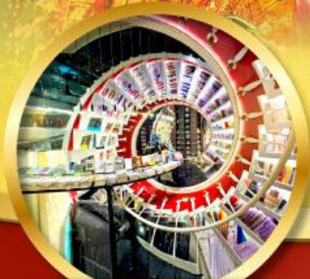
ร้านหนังสือจตุเก๋