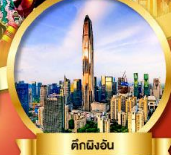
ดีคิงอัน