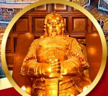
วัดแซงหนิว

นมัสการองค์เจ้าแม่กวนอิม อายุกว่า 600 ปี