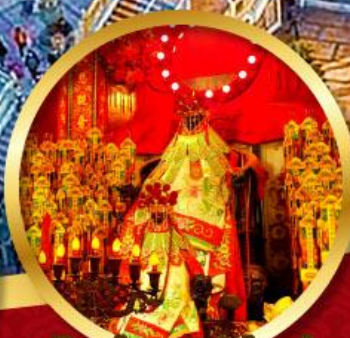
เจ้าแม่กวนอิมฮ่องอ่า

นมัสการองค์เจ้าแม่กวนอิม อายุกว่า 600 ปี