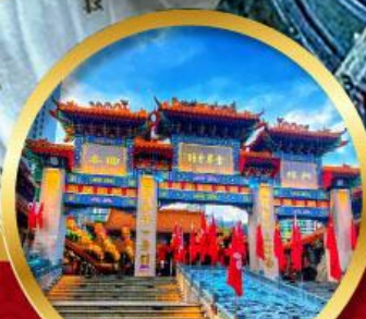
วัดหวังตักซิเยน