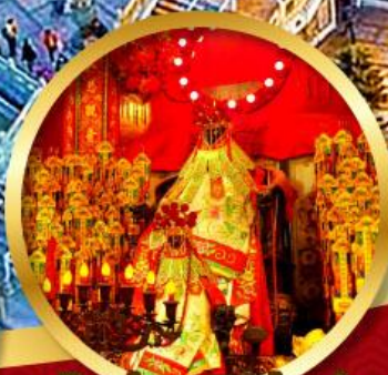
เจ้าแม่กวนอิมฮ่องอ่า

นมัสการองค์เจ้าแม่กวนอิม อายุกว่า 600 ปี