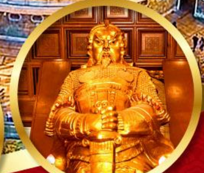
วัดแซงหับิว

นมัสการองค์เจ้าแม่กวนอิม อายุกว่า 600 ปี