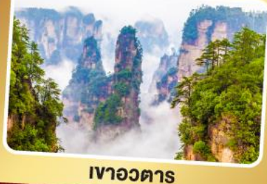
เวาอวดาร