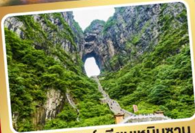
ประตูสวรรค์ เกียนเหมินซาน