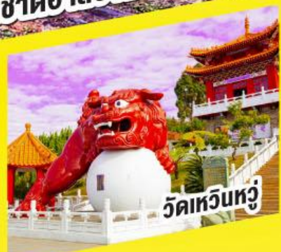
วัดเหวินทง