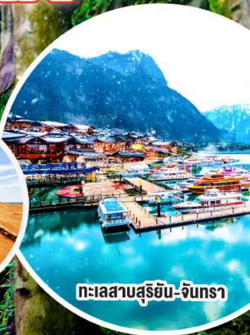
ทะเลสาบสุริยัน-จันทรา