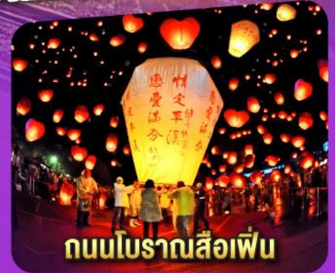
ถนนโบราณสี่กั๊ก