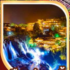
เมืองฟูหรงเจิ้น