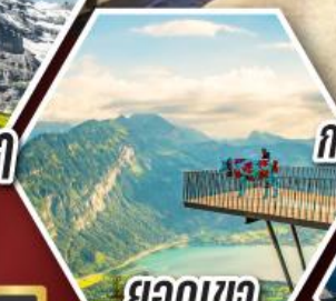
ยอดเขา กรินเดลวาลด์ เพียสตี