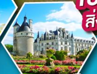
ปราสาทเชองงโซ

เข้าชมมหาวิหารมรดกแห่งต์มิเชล สิ่งมหัศจรรย์ของประเทศฝรั่งเศส