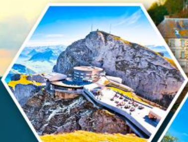
ยอดเขาพิลาตัส