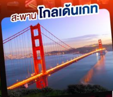
สะพานโกลเดนเกต