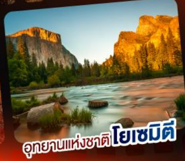
อุทยานแห่งชาติโยเซมิตี