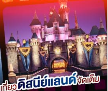
เที่ยวดิสนีย์แลนด์จัดเต็ม