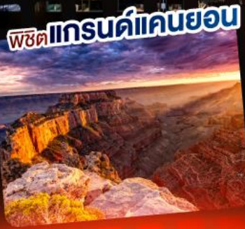
พิชิตแกรนด์แคนยอน