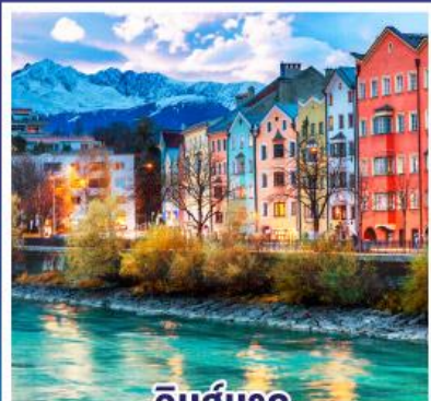
อินส์บรุค