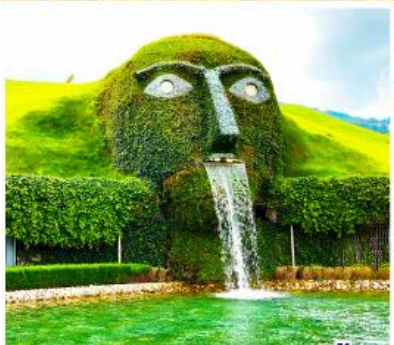
พิพิธภัณฑสถานวอร์ฟสกี