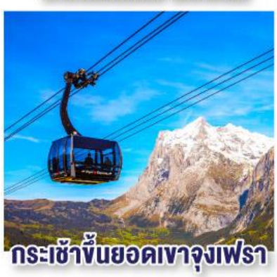
กระเช้าขึ้นยอดเขาจุงเฟรา