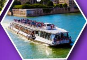
ล่องเรือบาโตมุช ชมกรุงปารีส

เที่ยวเมืองวาตูซ เมืองหลวงของสาธารณรัฐ ลิกเทนสไตน์