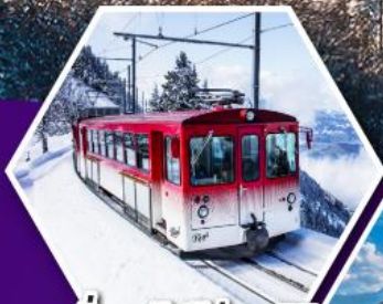
นั่งรถไฟใต้เขาริกิ