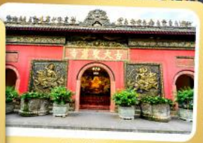
วัดต้าอื่อ