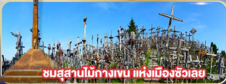
ชมสุสานไม้กางเขน แห่งเมืองซิวลเย