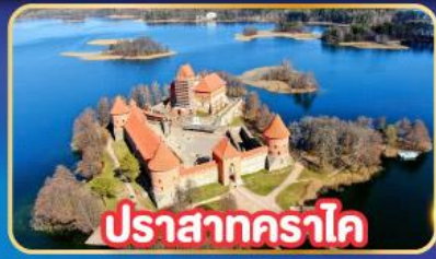
ปราสาทคราไค

พิเศษ! เกี่ยวเก็บครบทุกประเทศยุโรปเหนือ ลิทัวเนีย , ลัตเวีย , เอสโตเนีย , ฟินแลนด์