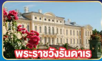
พระราชวังรินคาส