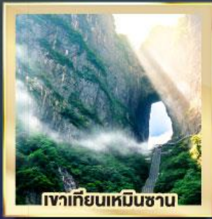
เขากเทียนเหมินซาน