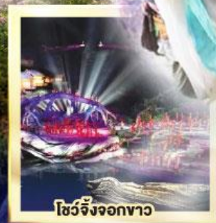
โชว์จิ้งจอกขาว