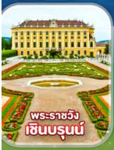
พระราชวัง เซินบรุนน์