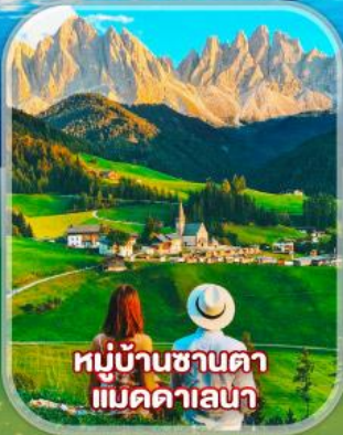
หมู่บ้านซานตา แม็คคาเลนา