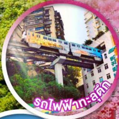
รถไฟฟ้า-ลู่ตัก