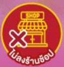
ไม่ลงร้านช้อป