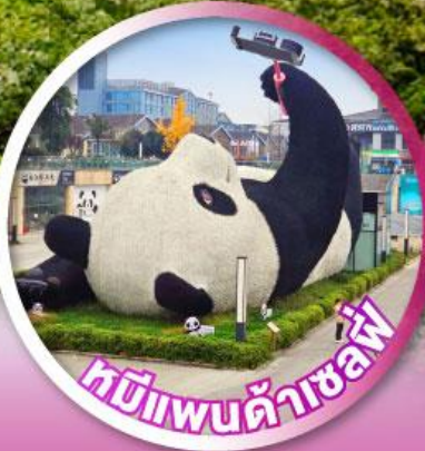
หมีแพนด้าซอฟี่