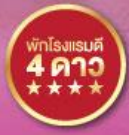
พักรูแรมดี 4 ดาว