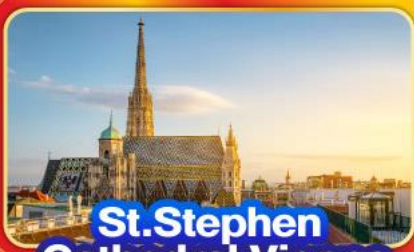
St. Stephen Cathedral Vienna