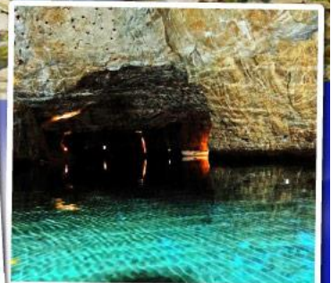
ทะเลสาบใต้ดินเซนต์เลียวนาร์ด

ล่องเรือชมทะเลสาบใต้ดินเซนต์เลียวนาร์ด ทะเลสาบใต้ดินลึกลับ สุดUnseenแห่งสวิตเซอร์แลนด์