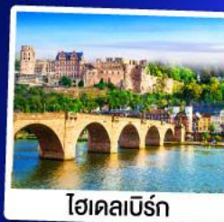
ไฮเดิลเบิร์ก