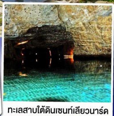
ทะเลสาบใต้ดินเซนท์เลียวนาร์ด

ล่องเรือชมทะเลสาบใต้ดินเซนท์เลียวนาร์ด ทะเลสาบใต้ดินลิกลิบ สุดUnseenแห่งสวิตเซอร์แลนด์