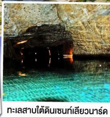
ทะเลสาบใต้ดินเซนท์เลียวนาร์ด

ล่องเรือชมทะเลสาบใต้ดินเซนท์เลียวนาร์ด ทะเลสาบใต้ดินลึกลับ สุดUnseenแห่งสวิตเซอร์แลนด์