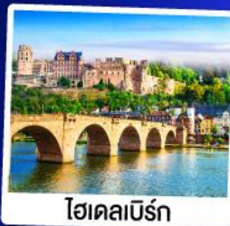
ไฮเดิลเบิร์ก