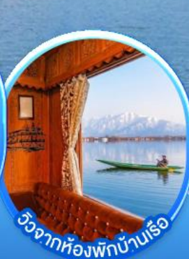
วิวจากห้องพักบ้านเรือ