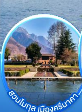
ฮอนโมกุล เมืองศรีนาตา