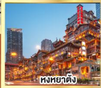
หงหยาดัง