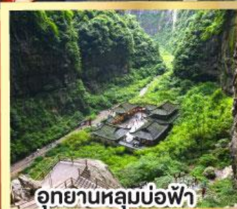
อุทยานหลุมบ่อฟ้า