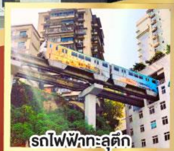
รถไฟฟ้าทะลุคิก