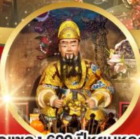
วัดเซกง 600 ปี หยูหลอง