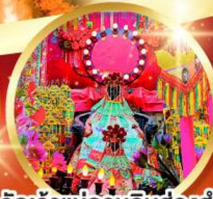
วัดเจ้าแม่กวนอิมอ่องอำ