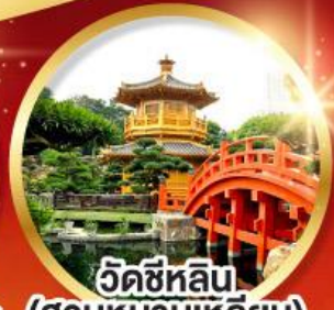
วัดซีหลิน