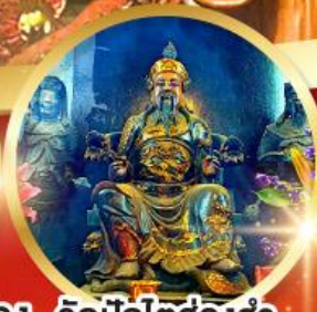
วัดปักโต้อ่องอำ