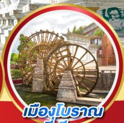
เมืองโบราณ ลี่เจียง