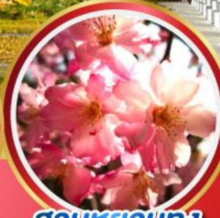
สวนหยวนทง