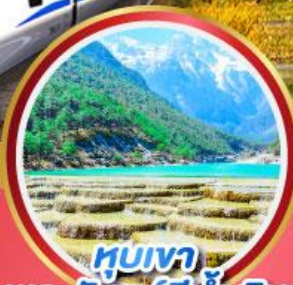
หุบเขา พระจันทร์สีน้ำเงิน